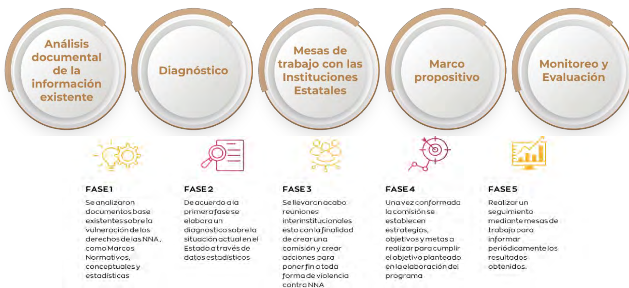
Esquema 1. Fases del proceso metodológico para la formulación del programa