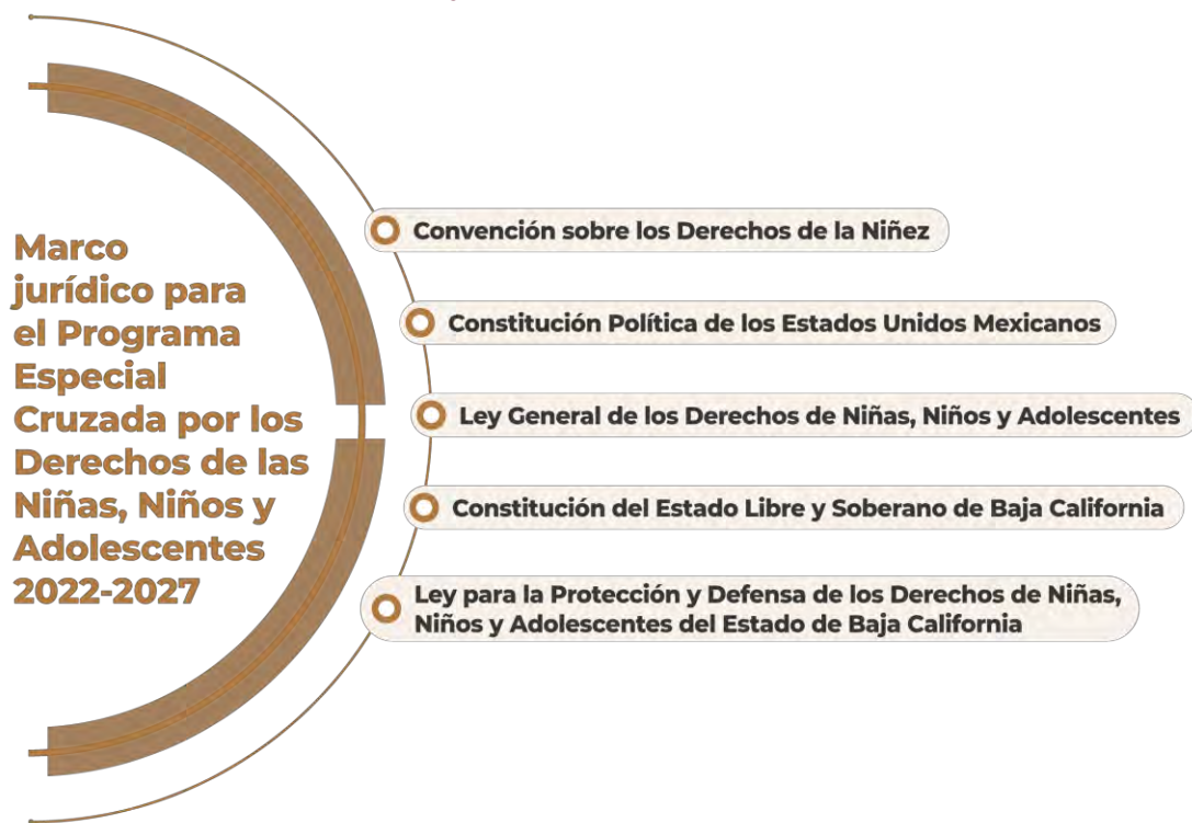
Figura 2. Marco jurídico para el Programa Especial Cruzada por los Derechos de las Niñas, Niños y Adolescentes 2022-2027

Fuente: Elaborado por COPLADE con información de DIF Baja California.